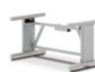
電動式可動スタンド