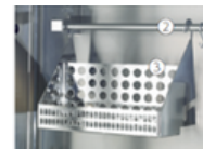
バスケット・バー