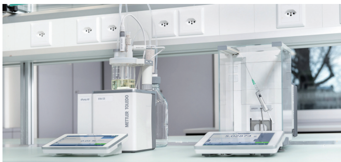
EVA と天秤を接続して使用することも可能